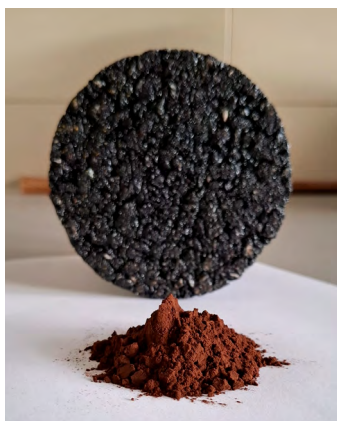
Figure 1 - Lignine sous forme de poudre

Dans ce contexte, le nouveau projet de recherche THEM-SBO BEAM (Bio-binders for Eco-friendly Asphalt Materials), a officiellement démarré le 1 er mars 2026. Dans le cadre de ce projet de trois ans, le CRR, VITO (groupes de recherche SPOT et ADVANCE) et Universiteit Antwerpen (groupe de recherche SuPAR) vont développer conjointement des liants biologiques et des enrobés bitumineux biosourcés à base de lignine, dans le but de rendre les enrobés plus durables, plus circulaires et moins dépendants des ressources fossiles.