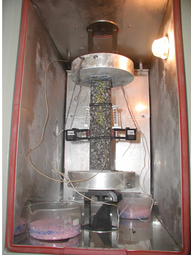
Figuur 1: Asfaltproefstuk geïnstalleerd voor het uitvoeren van de TSRST-proef.

Het proefstuk wordt onderworpen aan een constante temperatuursgradiënt van -10^{\circ}\text{C}/\text{u} (deze kan eventueel aangepast worden), terwijl de lengte van het proefstuk constant gehouden wordt. Hierdoor zal er spanning in het proefstuk opgebouwd worden waardoor het abrupt scheurt bij een bepaalde kritische temperatuur ( T_{\text{crack}} ). Daarnaast wordt een bijkomende kritische temperatuur bepaald, namelijk de transitietemperatuur ( T_{\text{trans}} ), waarbij de spanning-temperatuurcurve overgaat naar volledig lineair gedrag. Beide worden voorgesteld in figuur 2. Doorgaans wordt de kritische temperatuur T_{\text{crack}} vergeleken met de laagste temperatuur die in de verharding wordt gemeten. Indien T_{\text{crack}} lager is dan de laagst voorkomende temperatuur van de asfaltverharding, dan wordt aangenomen dat er in de praktijk geen risico bestaat dat lage temperatuurscheurvorming zal optreden. (ref. 2 )