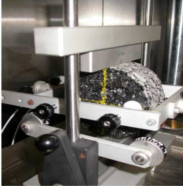
Figuur 3: Cilindrisch proefstuk geïnstalleerd in de IT-CY proef.

De cilindrische proefstukken hebben een diameter van 100 of 150 mm en een dikte tussen 30 en 75 mm). Tijdens de proef worden de proefstukken herhaaldelijk krachtgestuurd belast met tussenpauzen tot 3s. De kracht volgt een haversinus ( (124 \pm 4) ms opgaand tot de maximale kracht) en wordt aangepast zodat de proef in het lineair gebied van het materiaal gebeurt en er dus geen blijvende vervorming optreedt in het proefstuk. De kracht wordt zo geregeld dat de totale horizontale rek (5 \pm 2)\mu\text{s} bedraagt. De horizontale vervorming wordt gemeten en samen met de maximale kracht en poisson coëfficiënt kan de stijfheid van het asfaltmengsel bepaald worden. De proef bestaat uit 10 conditioneringscycli voor het bepalen van de juiste kracht. Nadien wordt het proefstuk 5 keer belast en wordt de gemiddelde stijfheid berekend over die 5 metingen.